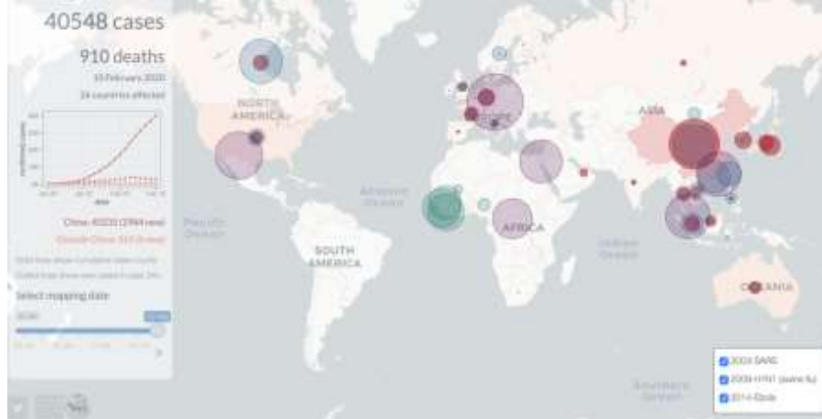
(شكل ٣) خريطة متابعة انتشار فيروس كورونا على مدار الساعة لمدرسة لندن للصحة

٤- قدمت منظمة ملاحظة البيانات المفتوحة Open Data Watch باعتبارها منظمة غير حكومية وغير ربحية أسسها ثلاثة متخصصين في بيانات التنمية، مبادرة بخصوص بيانات كوفيد ١٩ بتجميع بعض المقالات الأكثر فائدة، وتنظيمها حسب: التوافر والانفتاح والنشر والاستخدام والاستيعاب. ويتم نشر تلك البيانات وما يصاحبها من خرائط على موقع إلكتروني (شكل ٤) ( https://opendatawatch.com/ ). كما يتم تحديث الموقع مع توفر معلومات جديدة.