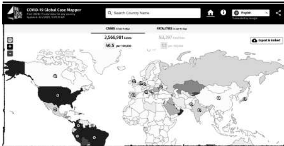
(شكل ٢) الخريطة العالمية الجديدة لـ كوفيد ١٩ للصحفيين

٣- طورت مدرسة لندن للصحة والطب الاستوائي London School of Hygiene & Tropical Medicine أداة جديدة لرسم خرائط تفشي عدوى ومرض كوفيد ١٩، وذلك بإنشاء موقع إلكتروني يتم تحديثه يوميًا بناءً على الأرقام التي تنشرها منظمة الصحة العالمية (WHO)، بينما يتم تحديث برامج التتبع الحية الأخرى التي طورتها جامعة جونز هوبكنز ومنظمة الصحة العالمية بشكل مستمر. وتتيح الأداة للمستخدمين استعادة عقارب الساعة وعرض الوضع العالمي لتفشي فيروس كورونا في أي يوم. كما أنه يمكن من مقارنة الوضع الذي يتكشف بالفاشيات الأخيرة الأخرى (Parker, 2020) (شكل ٣)