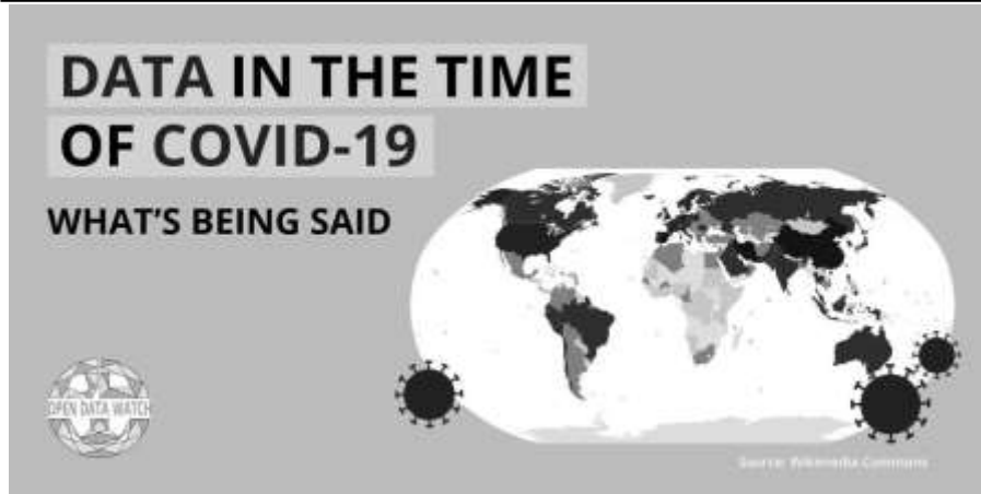
(شكل ٤) أحد نماذج ملاحظة البيانات المفتوحة عن كوفيد ١٩